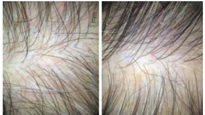
FIGURA 6: Paciente 2: Aspecto pré (à esquerda) e pós (à direita) três sessões de microagulhamento