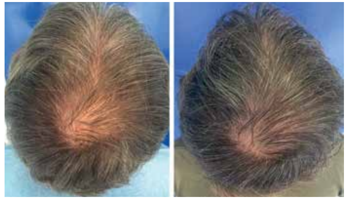
FIGURA 5: Paciente 2: Aspecto pré (à esquerda) e pós (à direita) três sessões de microagulhamento com máquina Cheyenne, sem infusão de medicações