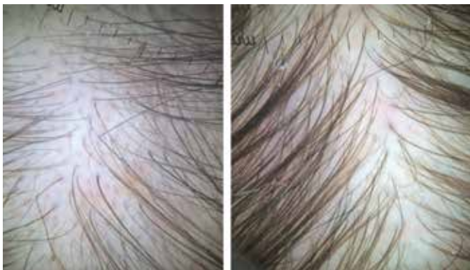
FIGURA 4: Paciente 1: Aspecto da tricoscopia do vértex pré (à esquerda) e pós (à direita) quatro sessões de microagulhamento e injeção de minoxidil

O tratamento clínico possui respostas variáveis e muitas vezes pouco satisfatórias. 4