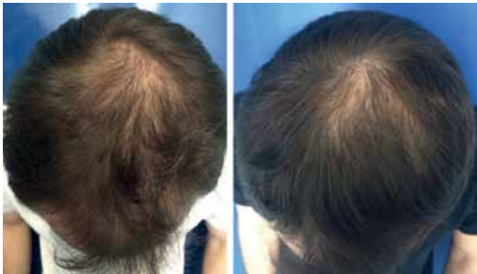
FIGURA 3: Paciente 1: Aspecto pré (à esquerda) e pós (à direita) quatro sessões de microagulhamento com máquina Cheyenne e infusão de minoxidil