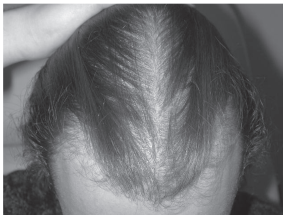
Figura 1. Aspecto clínico típico da alopecia androgênica masculina, rarefação frontal simétrica.

O início da AAG é extremamente variável, podendo iniciar com queda ou rarefação do cabelo na adolescência, na idade adulta ou no idoso. A presença do gene da Síndrome dos Ovários Policísticos (gene SOP) em homens parece estar correlacionada com o aparecimento precoce da AAG em meninos púberes ou pré-púberes 30,31 . A presença de andrógenos circulantes é fundamental para o desenvolvimento progressivo da rarefação. O grau de predis-